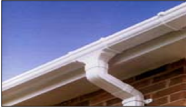
Figura 2. Canaletas de recolección

Para el caso de las primeras aguas es necesario contar con un dispositivo de descarga, pues constituyen una posible fuente de contaminación.