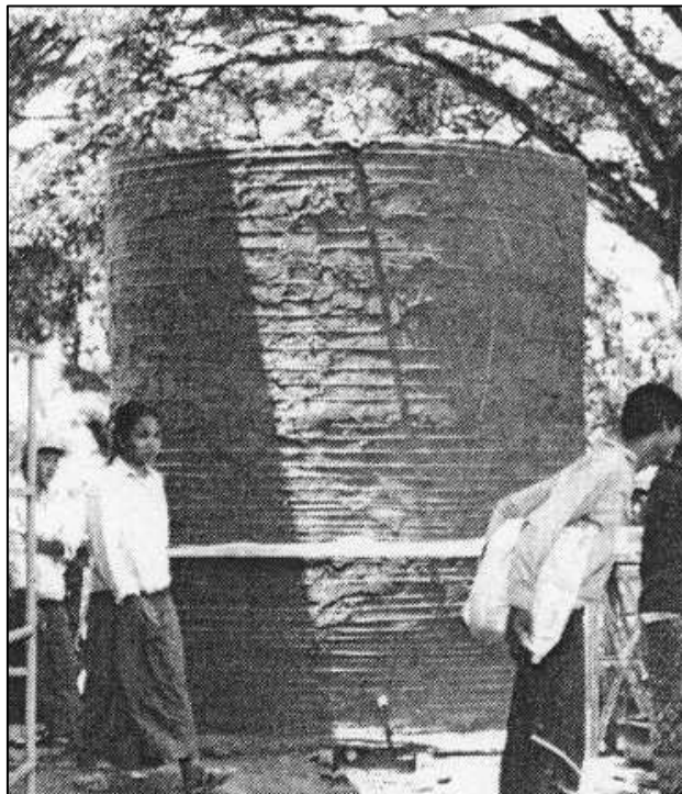
Figura 4. Tanque de Almacenamiento