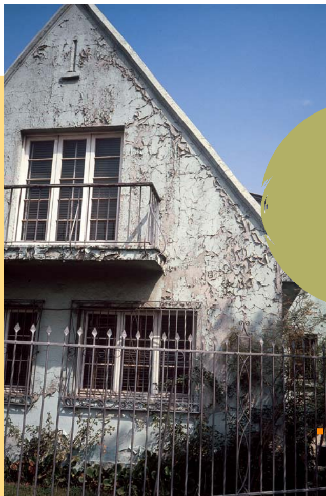
■ Película de óleo saponificada sobre estuco

La superficie así preparada presenta aún