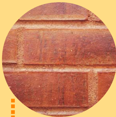
Ladrillo bien protegido

La protección de los ladrillos debe hacerse, debido a que en invierno absorben agua, la que al congelarse en el interior de ellos, se expande rompiéndolos. Los geólogos llaman a este proceso «Meteorización» y así se forman las arenas en los desiertos. Esto sucede rápida o lentamente, dependiendo de las condiciones climáticas bajo las cuales está la vivienda. A modo de ejemplo, en Punta Arenas y Calama, esto puede suceder al cabo de un año, que son zonas donde caen muchas heladas en el año. En la zona central caen generalmente pocas heladas; sin embargo en Colina, Lampa y Batuco, caen más heladas que en Santiago y, esto también puede ocurrir durante el primer año de exposición a la intemperie.