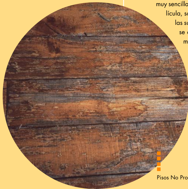
Pisos No Protegidos

Otra manera, es la protección de la madera en exteriores con productos que no forman películas, como los Impregnantes que están creciendo rápidamente en nuestro país; así el sol no tiene a quien dañar. Estos productos contienen Biocidas para impedir los posibles daños producidos por hongos, insectos y algas, como también filtros solares que retardan el agrisado de la madera. Su mantención después de dos a tres años es muy sencilla, porque al no haber película, solo bastará con eliminar las suciedades acumuladas y se aplicará una sola mano más de Stain.