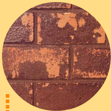
Ladrillo sin protección

jándolo actuar sólo durante unos 5 minutos y no más, enjuagándolos muy bien posteriormente, para evitar que el ácido se quede en el interior de ellos. Siempre debe evitarse el quemado con ácido; si es que se puede, debido a que los ladrillos en general son muy absorbentes y parte del ácido no podrá eliminarse, quedando parte de él en su interior. La superficie una vez seca y sin sales, presenta también un leve comportamiento alcalino, a pesar que los ladrillos de arcilla, no lo son. Esta alcalinidad la proporcionan las sales del mortero de pega. Debido a esto, sólo se podrán aplicar sobre ellos, diferentes tipos de látex, esmaltes al agua y productos especiales para ladrillos, como los selladores acrílicos incoloros y el «barniz para ladrillo».