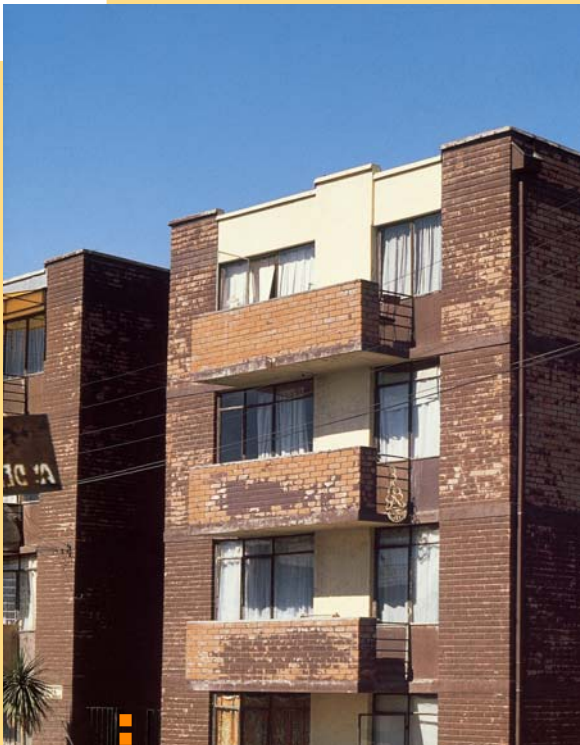
Ladrillo equivocadamente protegido con barniz marino.